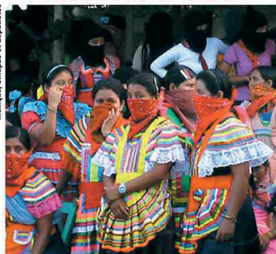
Mexique, Chiapas et Zapatistes

Dans nombre de départements, des militantes et militants Solidaires sont impliqués dans l'organisation de la tournée européenne des zapatistes. Une coordination européenne fonctionne, où Solidaires est également représenté. Avec les difficultés inhérentes à un tel projet, rencontres, débats et autres initiatives s'organisent.