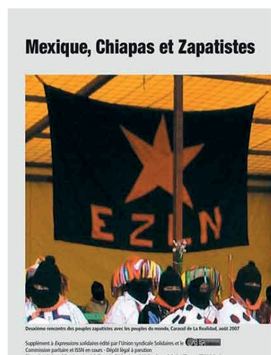
Mexique, Chiapas et Zapatistes

Deuxième rencontre des peuples zapatistes avec les peuples du monde, Caracol de La Realidad, août 2007 Supplément à Expressions solidaires édité par l'Union syndicale Solidaires et le C2S Commission paritaire et 5000 en euros - Dépôt légal à parution Directeur de la publication : Armand Coupat - Rédaction : 144, boulevard de la Villette - 75019 Paris