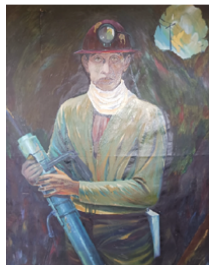
Peinture d'un mineur.

tractiviste, duquel aucun gouvernement de gauche latino-américain n'a réussi à s'émanciper.