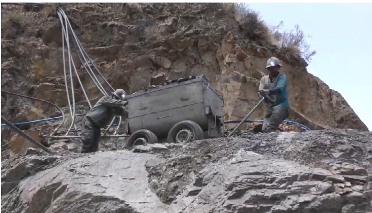
Deux mineurs extraient la roche

De ce fait, les femmes sont de plus en plus dépendantes économiquement des maris – ce qui, évidemment, les rend encore plus vulnérables à la violence masculine – ce que l'on verra dans le prochain article.