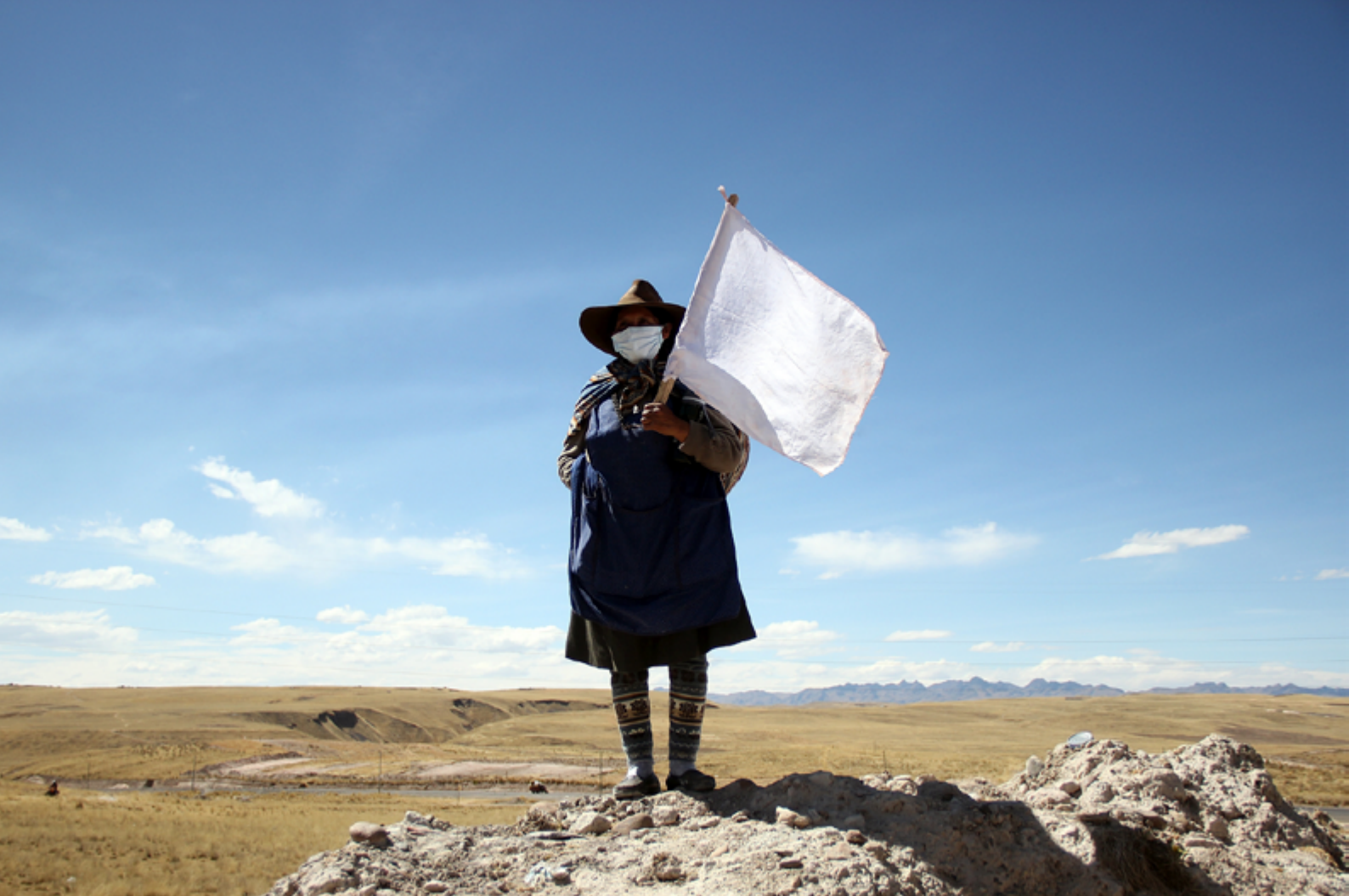
Les communautés d'Espinar en grève contre la société minière Glencore

femmes les plus pauvres, souvent les plus âgées. La solitude et l'inquiétude est pesante : elles ne savent pas quelle est la qualité de l'eau qu'elles boivent et qu'elles donnent à leurs enfants ou petits-enfants. Tout le monde tombe malade. Comme le déclare une femme d'une soixantaine d'année : « D'abord, c'est la santé : sans santé, il n'y a pas de travail. Après c'est le travail ».