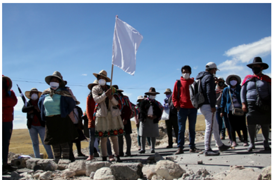
Les communautés d'Espinar en grève contre la société minière Glencore