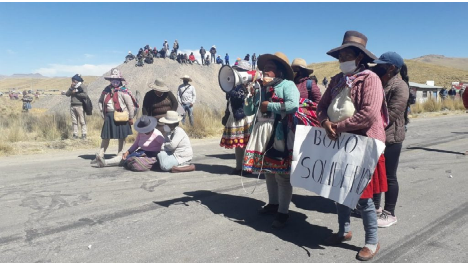
Répression contre les défenseur·es des droits à Espinar, Cusco, Pérou