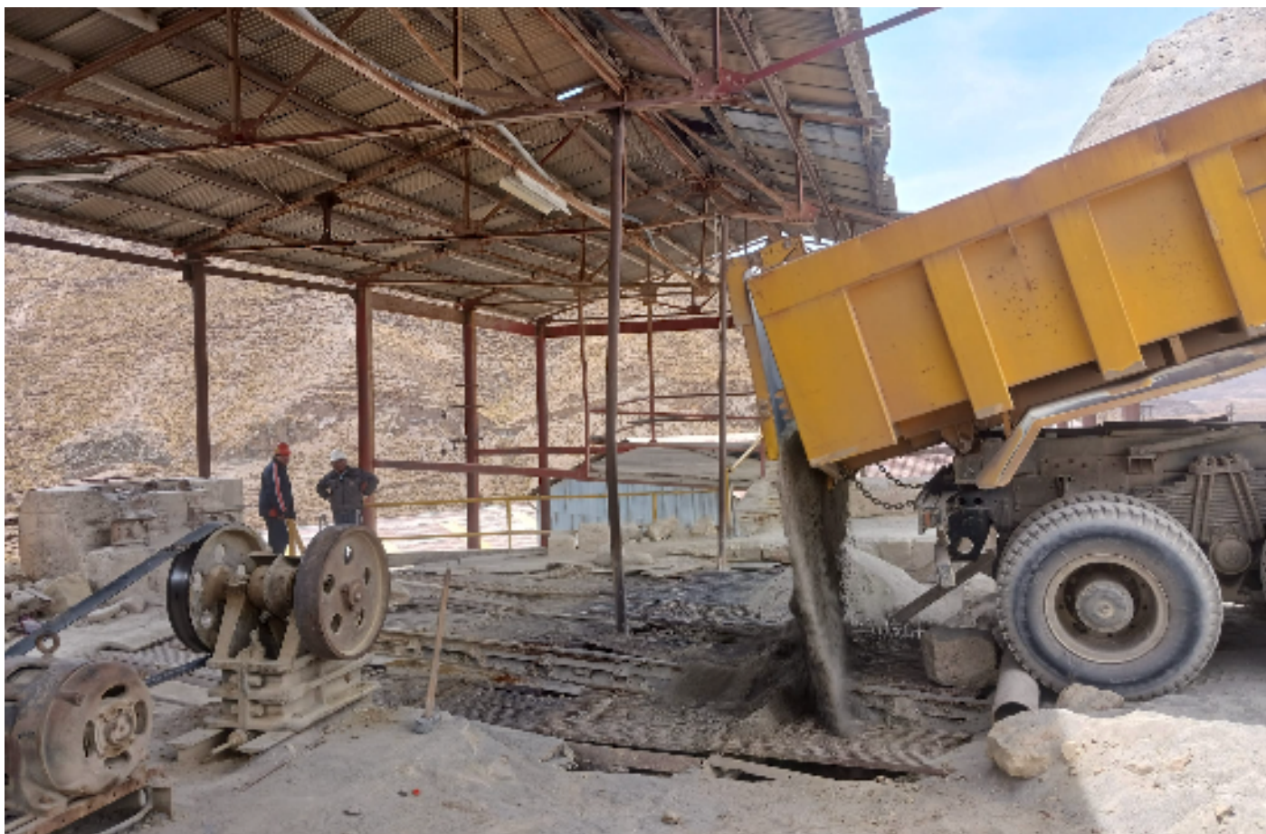
Une mine d'étain en Bolivie.

si, comme à l'époque coloniale, la qualité de vie des habitant-es de l'Europe – et les profits des industriels européens – continue d'être subventionnés par des activités qui externalisent l'exploitation du travail et des écosystèmes vers les pays anciennement colonisés.