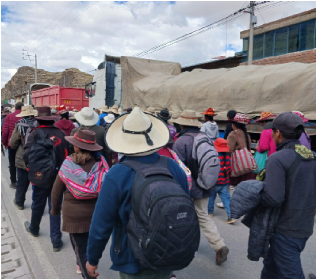
Mobilisation le 29 juillet 2023 et blocage du Corredor minier sud andin dans le district de Velille (Chumbivilcas). Les camions mis à l'arrêt, de l'entreprise Las Bambas, transportent du cuivre vers le port de Marantani

poissons pas centaines, et réduit à néant la capacité d'autoproduction pour l'autoconsommation. Comme l'explique une vieille dame de 80 ans à Espinar : « avant, on avait assez pour manger et pour vendre. Aujourd'hui, on n'a même plus assez à manger ». Sur les marchés, les client-es ne veulent pas acheter de produits agricoles de ces régions, par peur de l'intoxication par métaux lourds. On le voit, la question environnementale est d'abord une question économique : en polluant les eaux et l'air, l'industrie minière transnationale détruit les moyens de production de l'agriculture de subsistance.