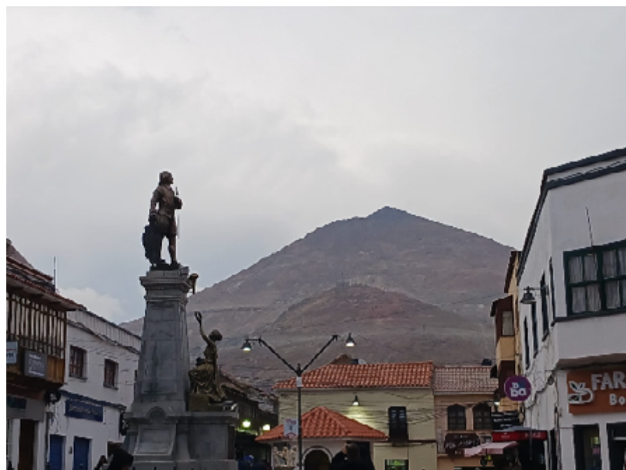
Le Cerro Rico de Potosi au fond, et une statue représentant l'arrogance coloniale espagnole au premier plan.

nient de représenter la colonne vertébrale du capitalisme mondialisé, pour le bénéfice des industries des pays anciennement colonisateurs (l'Europe et les pays qui ont hérité de sa blancheur, comme l'Amérique du Nord). Pour ne prendre qu'un exemple, la transition énergétique en France et ailleurs implique la production massive de panneaux photovoltaïques, de véhicules électriques et autres technologies qui, si elles n'émettent pas de gaz à effet de serre au moment de fonctionner, requièrent pour leur production encore plus de métaux rares et de minerai. Sans l'extraction massive du lithium en Amérique du Sud, ou du cobalt en République Démocratique du Congo, la transition énergétique européenne – mais aussi la «société tout numérique» et de manière générale, toute la production mondiale dont les profits sont concentrés en Europe, en Amérique du Nord et en Chine – s'écroule.