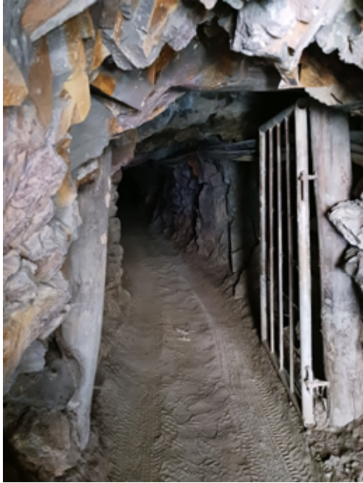
Entrée à la galerie minière souterraine

Dans le cadre de l'exploitation des richesses par les entreprises minières transnationales, mais aussi des mines informelles, les transformations socio-économiques sont profondes et drastiques. Il s'agit d'une économie ultra-masculinisée, qui exclue de fait la plupart des femmes. Les cinquième et sixièmes articles de la série « Les femmes, les mines, la terre » expliquent ce que l'expansion des relations capitalistes (puisqu'il s'agit bien de ça) « fait » aux rapports sociaux de sexe.