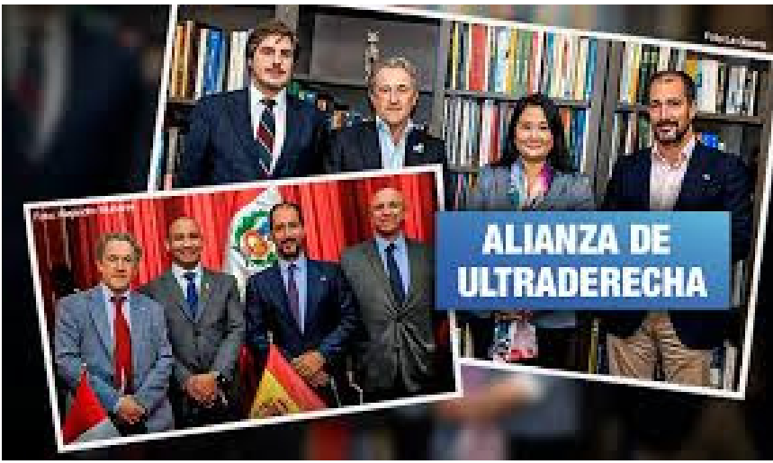
Alliance des extrêmes droites: Keiko Fujimori, la fille de l'ancien dictateur Alberto Fujimori qui a passé 15 ans en prison pour corruption et crimes divers (exécution extra judiciaires, etc) avec des représentants du parti espagnol d'extrême droite Vox

On assiste donc à une boucle néocoloniale : l'armée française forme les polices et armées nationales à réprimer les mouvements sociaux qui contestent l'extractivisme, grâce auquel sont produites les armes 'high-tech' qu'elle utilise pour asseoir sa domination. Lutter contre la militarisation en France est donc une branche essentielle de solidarité avec les populations qui subissent l'extractivisme sur leur territoire.