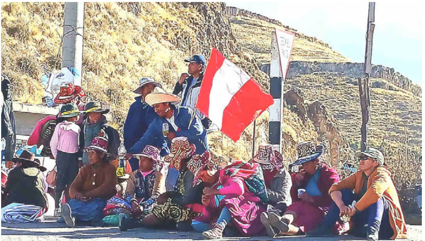
Mobilisation contre la «présidente» Dina Boluarte, l'extrême-droite fujimoriste et les entreprises transnationales. Chubivilcas, juillet 2023

Ce sont bien des politiques publiques dans des pays comme la France qui sont ici en cause. D'abord, il s'agit de lutter contre les discours qui promeuvent l'individualisation de la responsabilité dans les discours écologiques (c'est-à-dire le capitalisme vert, le greenwashing). Re-politiser les causes du changement climatique est essentiel pour mettre en cause la sortie techno-solutionniste comme les énergies vertes ou les véhicules électriques, privilégiée