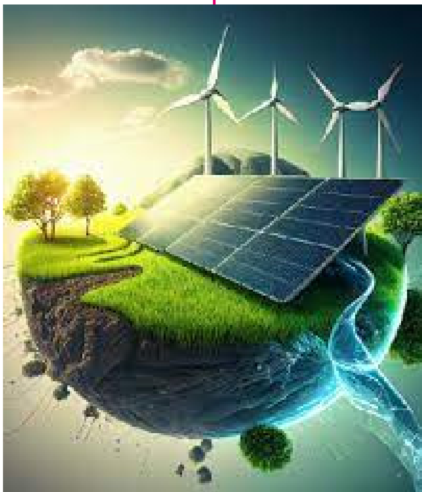
Contre la transition énergétique capitaliste et les technologies vertes prédatrices de ressources minières

Selon la sociologue Jules Falquet, environ 10 % de l'électronique mondiale est utilisée par les militaires, notamment par l'armée états-unienne. Une collaboration entre l'Observatoire des Armements et la campagne BDS a récemment montré que des entreprises grenobloises comme ST Microelectronics ou