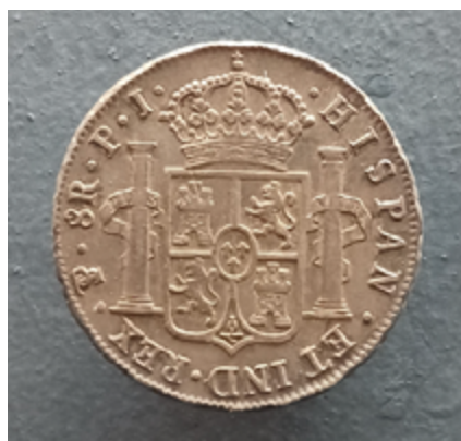
Un pièce d'argent de Potosi à l'époque coloniale.

où l'Église Catholique s'écroule, le monde tomberait aux mains des Protestants». Cette vision apocalyptique en dit long sur la centralité de l'industrie de l'argent dans les mines de Potosi (aujourd'hui en Bolivie, appartenant jadis à la Vice Royauté du Pérou) dans l'économie mondiale euro-centrée : l'argent de ces mines immenses a financé les guerres des monarques européens, et a surtout permis l'accumulation primitive du développement capitaliste européen.